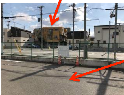
アインス専用駐車場